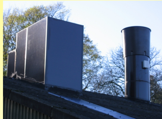
Wärmetauscher und Abluftkamin