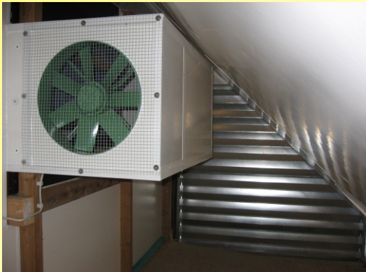
Zuluftventilator für Wärmetauscher