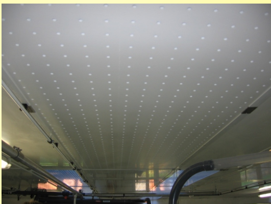
Klimadecke mit Zuluftlochplatten