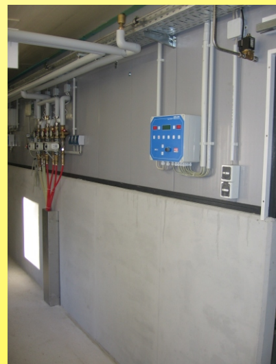
Regelgerät DR 4

Tel.: 033971-31473 Fax : 033971-32483 Mob: 0171-8239718