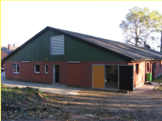
Jalousieklappe zu Zuluftspeisung

Abferkelstall mit Deckzentrum in 24327 Blekendorf Inbetriebnahme Herbst 2006